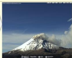
Imagen destacada de las últimas 24 horas

CON LA PARTICIPACIÓN DEL INSTITUTO DE GEOFÍSICA DE LA UNAM