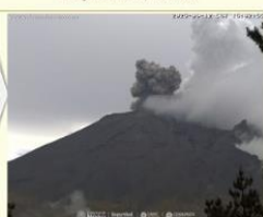
Imagen destacada de las últimas 24 horas.

CON LA PARTICIPACIÓN DEL INSTITUTO DE GEOFÍSICA DE LA UNAM