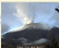
Imagen destacada de las últimas 24 horas

CON LA PARTICIPACIÓN DEL INSTITUTO DE GEOFÍSICA DE LA UNAM