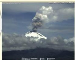
Imagen destacada de las últimas 24 horas

CON LA PARTICIPACIÓN DEL INSTITUTO DE GEOFÍSICA DE LA UNAM