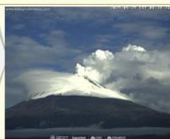
Imagen destacada de las últimas 24 horas

CON LA PARTICIPACIÓN DEL INSTITUTO DE GEOFÍSICA DE LA UNAM