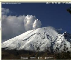
Imagen detectada de las últimas 24 horas

CON LA PARTICIPACIÓN DEL INSTITUTO DE GEOFÍSICA DE LA UNAM